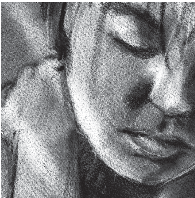
illustraties: Isabel Sluitman

nue onzekerheid over de basiselementen van je bestaan. Als je eenmaal woonruimte en werk of een opleiding hebt gevonden, dan valt er een brief