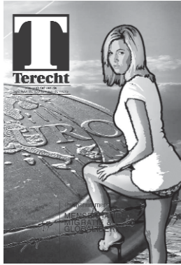
coverillustratie: Isabel Sluitman

Deze publicatie kwam tot stand dankzij financiële ondersteuning van: