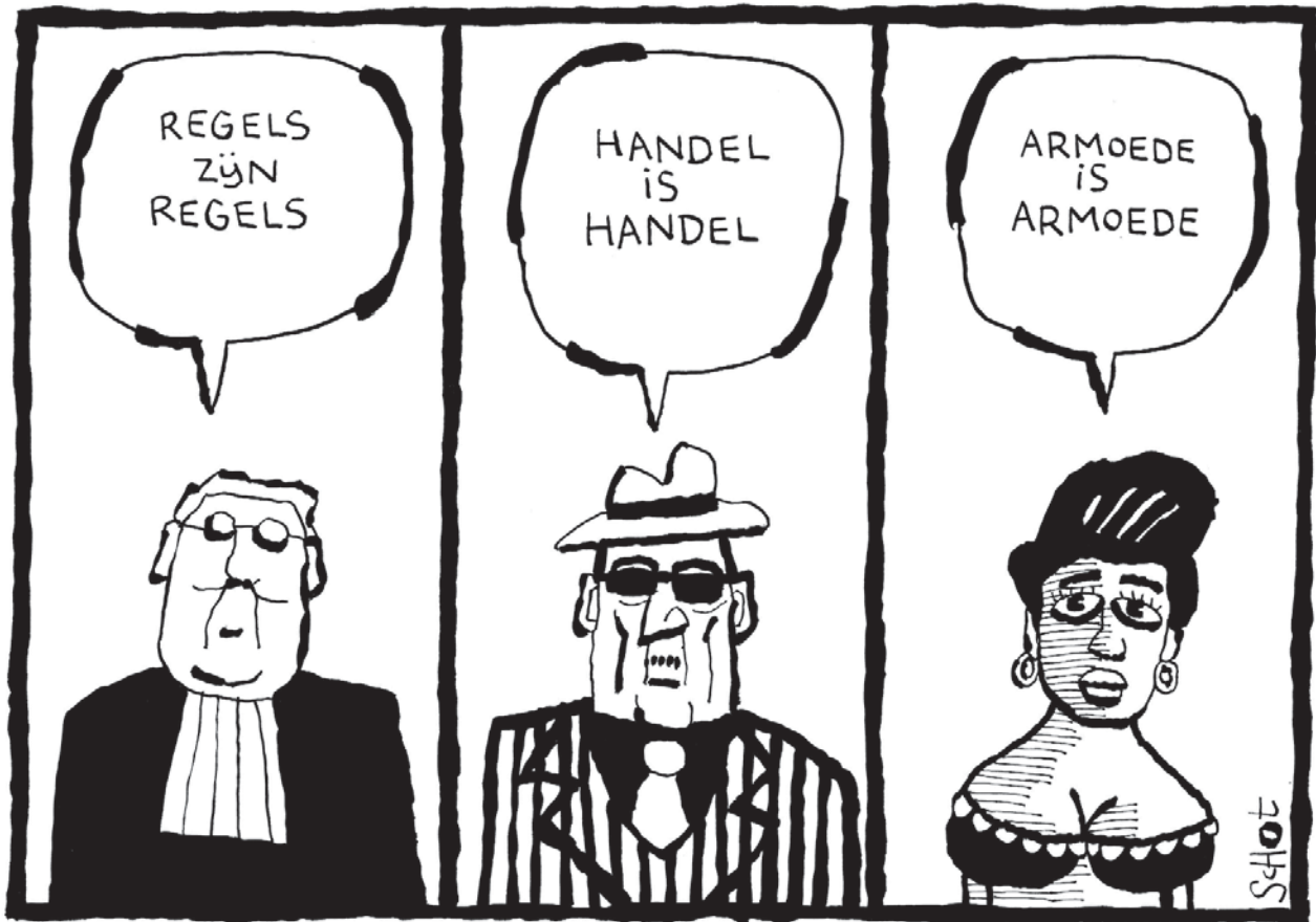
illustratie: Bas van der Schot

lijkheid te werken en met minimale voorzieningen. Het is nooit de bedoeling geweest vreemdelingen lang vast te zetten, dus uitgebreide voorzieningen, zoals in strafgevangenis, zijn niet nodig volgens het huidige beleid. Maar veel gedetineerde illegalen zitten maandenlang vast, sommigen zelfs een jaar of langer. En dat zonder een strafbaar feit te hebben gepleegd.